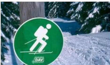
Beschilderung von Skitouren.

Bergsportler und Medien berichten derzeit immer wieder von überlasteten Wintersportgebieten im Schwarzwald und auf der Schwäbischen Alb. Es geht um touristische Überlastungen von Erholungsgebieten und Verstöße gegen Corona-Regeln. Aber auch um Naturschutzbelange wie Nicht-Beachtung von Schutzgebieten und verbotene Abfahrten durch sensible und geschützte Winterlebensräume von Wildtieren.