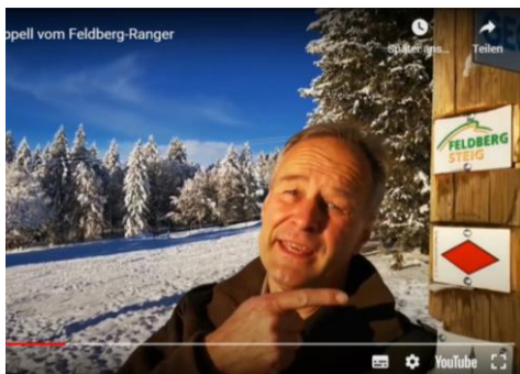
Der Feldberg-Ranger auf Youtube