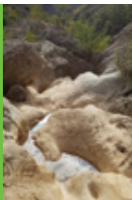
Schlucht in der katalanischen Provinz Lleida

Deutscher Alpenverein e.V. Sektion Baden-Baden /Murgtal Flugstraße 17, 76532 Baden-Baden Gewerbegebiet Oos-West Telefon: 07221 17200, Telefax: 07221 17230 E-Mail: info@alpenverein-baden-baden.de Internet: www.alpenverein-baden-baden.de